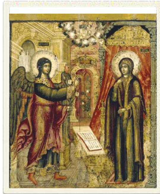
Illustration tirée de http://www.spiritualite-orthodoxe.net/annonciation_orthodoxie.html .

Thot serait ainsi « l'ancêtre » de l'ange Gabriel , tandis que « la plus noble et la plus belle des dames » (généralement une épouse d'un prêtre de Rê) préfigure Marie, la seule véritable variation entre ces deux annonces résidant dans la conception (l'incarnation du Souffle divin ou du Verbe) provoquée par le nez (l'odeur de sainteté / Amon) ou par l'oreille (Dieu).